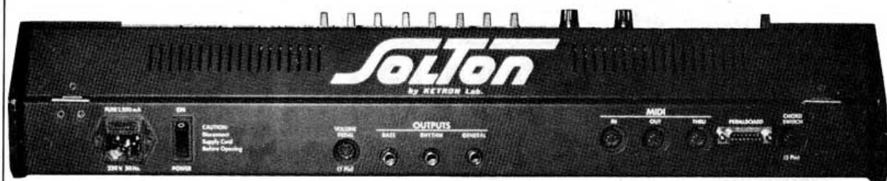
Face arrière et les prises de liaison.

tions) uniquement à partir d'un accord joué sur le clavier. Les variations s'adaptent au type d'accord joué (majeur, mineur, septième).