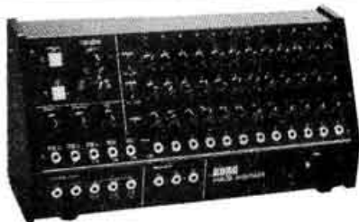
SQ-10 Analog sequencer.