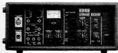
SE-500 Stage echo. Prix : 3 900 F Echo delay. Son sur son