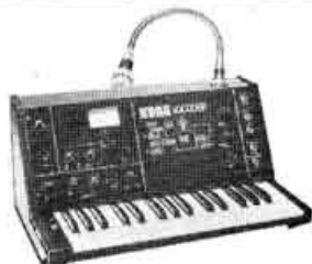
VC-10 Vocoder. Prix : 6 800 F