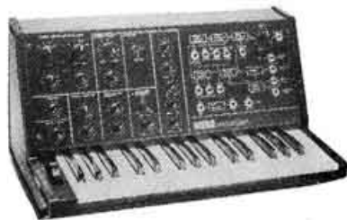
MS-10 Monophonic synthesizer. 1 oscillateur