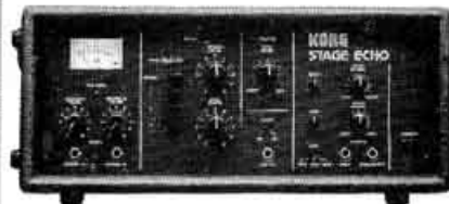
SE-300 Stage echo, reverb. Prix : 2 900 F