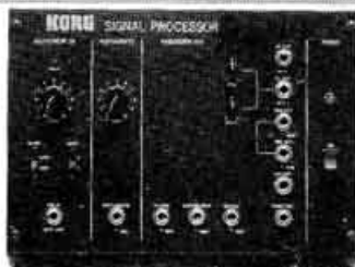
MS-03 Signal processor. Prix : 1 450 F (à brancher dans le MS-50)