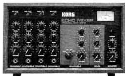
EM-570 Echo mixer, stéréo 2 x 35 W. Prix : 2 800 F