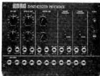
MS-02 Interface. Prix : 1 150 F