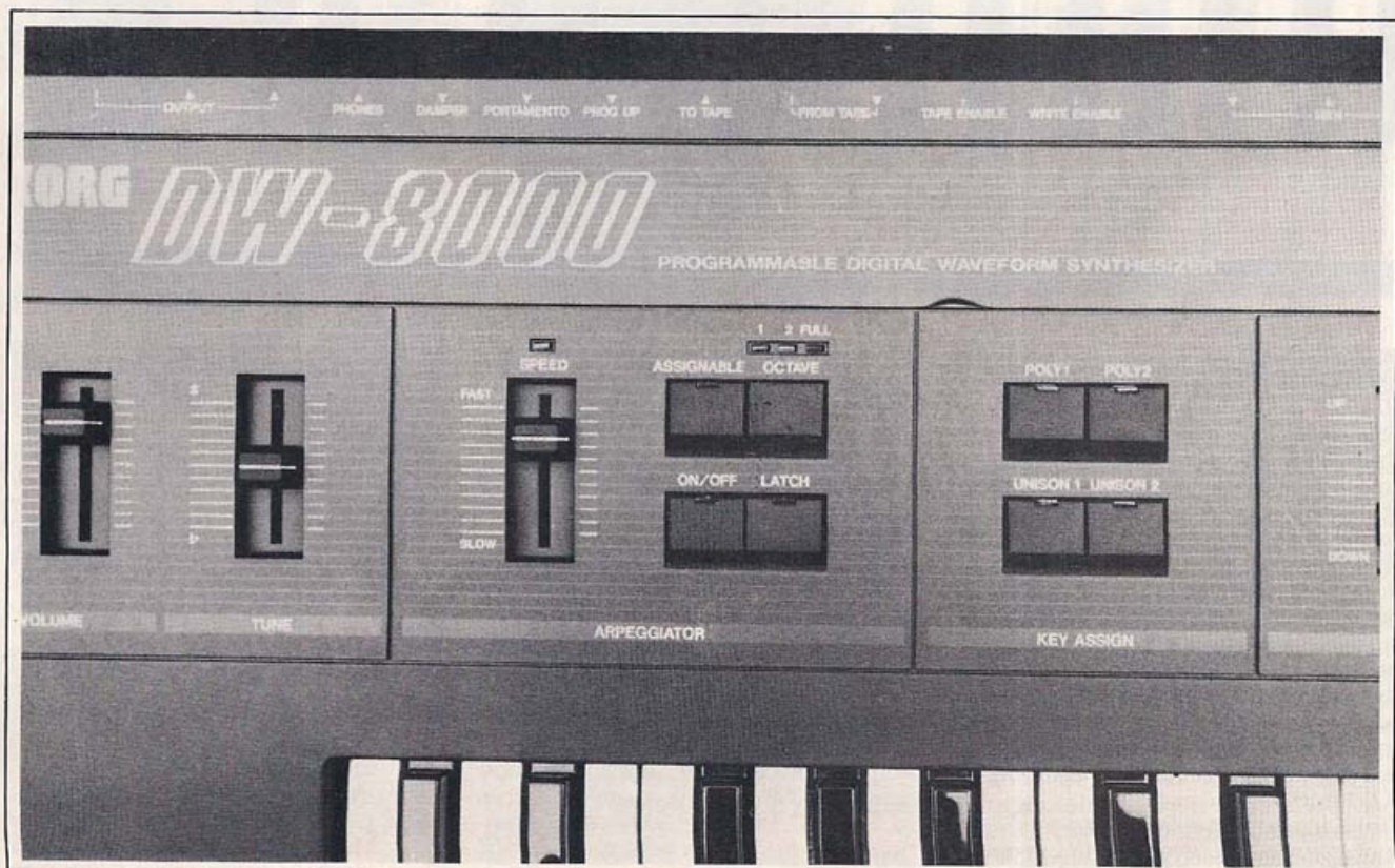
L'arpégiateur est de retour sur le nouveau Korg.