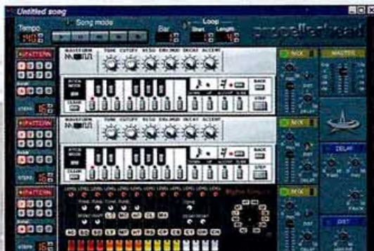
L'émulateur ReBirth 383 de Propellerhead.

alentours de $200 (environ 1 000 F), ce qui est peu cher payer au regard des performances et du clonage quasi irréprochable. Vient ensuite Rubber Duck, un shareware allemand vendu au prix $15/20 DM, disponible uniquement pour PC (Windows 95) qui malgré une interface peu