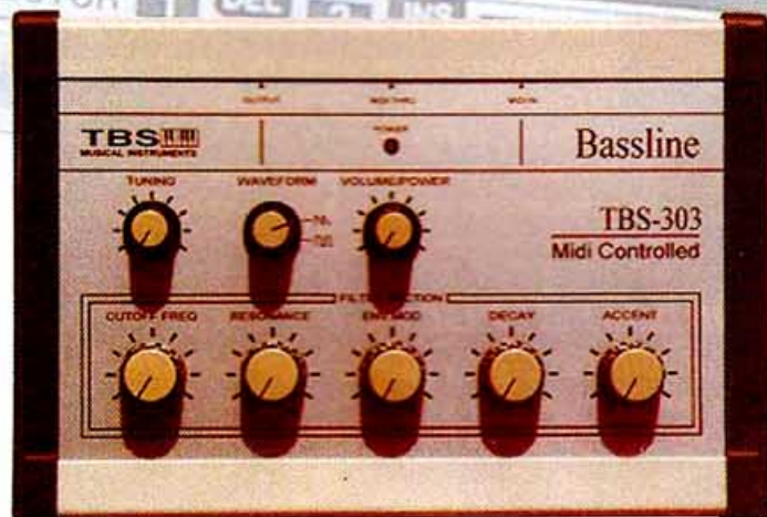
La TBS 303, le seul clone construit d'après les plans originaux de la TB-303.