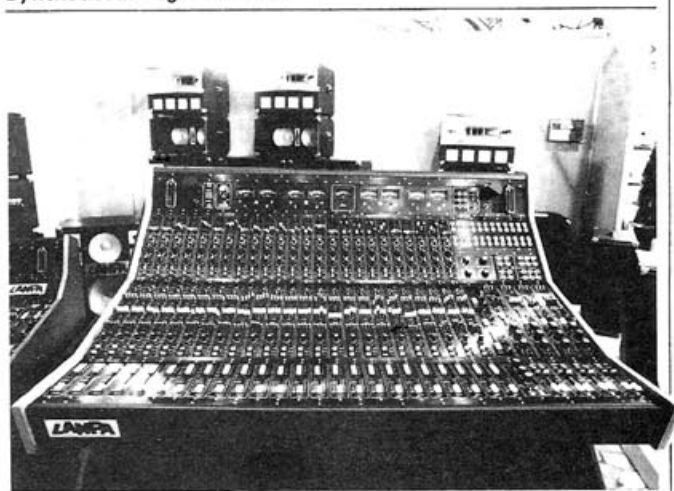
Table de mixage professionnelle Lampa