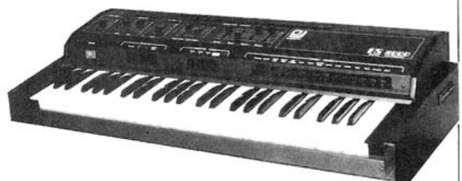
Synthétiseur Elgam ES 200